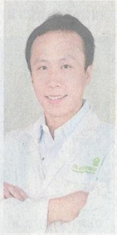
พิชิต องค์กรจรกุล

ให้ลูกตั้งแต่เกิด หรือในวัยผู้ใหญ่ก็สามารถเป็น โรคนี้ได้ ถ้าอยู่ในสถานที่ที่มีความเสี่ยง โดย ศูนย์บริการและวิจัย โรฝุ่นศิริราช ภาควิชา ปรสิตวิทยา คณะแพทย- ศาสตร์ศิริราชพยาบาล ม.มหิดล ได้ศึกษาวิจัย พบว่าคนไทยมากกว่า ร้อยละ 50 หรือคนไทย กว่าครึ่งประเทศกำลัง เป็นโรคภูมิแพ้ ซึ่งโรค ภูมิแพ้มีหลายชนิด แต่ ที่มารวมเป็นอันดับ 1 คือ โรคภูมิแพ้โรฝุ่น โดย