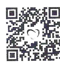
QR Code ลงทะเบียนออนไลน์