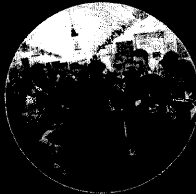
เมืองสุขภาพดี วิถีชุมชน