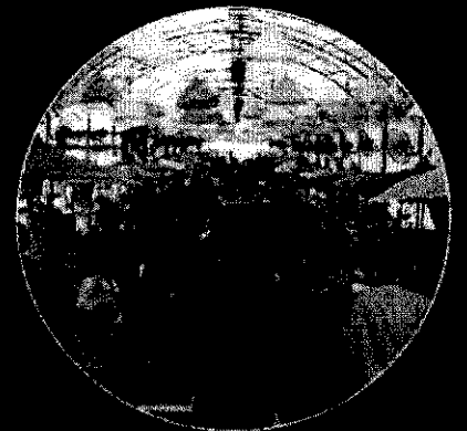
ตลาดวัฒนธรรม