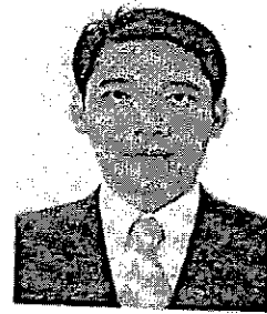
นายก่อกิจ ด้านชัยจิตร ที่ปรึกษารัฐมนตรีว่าการกระทรวง การท่องเที่ยวและกีฬา