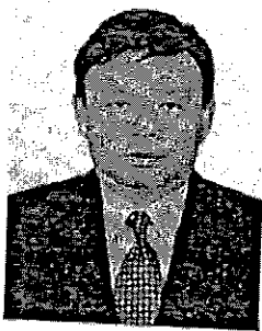
นายฐากร ตัณฑสิทธิ์ รองเลขาธิการ กทช. รักษาการในตำแหน่งเลขาธิการ กทช.